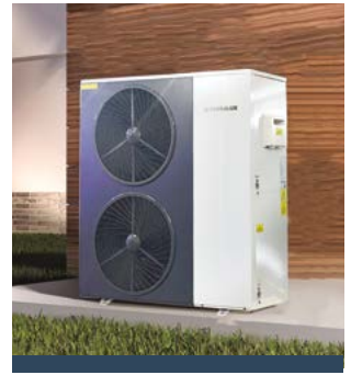
TERRALUX SUNGLOW 20 MONOBLOKK LEVEGŐ-VÍZ HŐSZIVATTYÚ