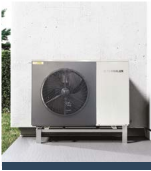
TERRALUX SUNGLOW 9 MONOBLOKK LEVEGŐ-VÍZ HŐSZIVATTYÚ