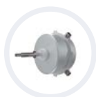
Szénkefe nélküli motor