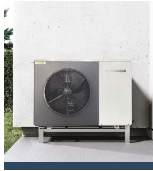
TERRALUX SUNGLOW 12 MONOBLOKK LEVEGŐ-VÍZ HŐSZIVATTYÚ