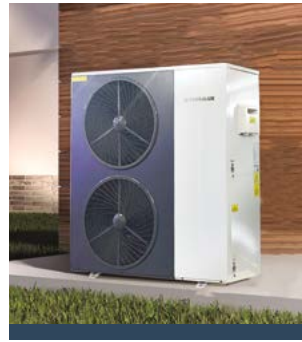
TERRALUX SUNGLOW 16 MONOBLOKK LEVEGŐ-VÍZ HŐSZIVATTYÚ