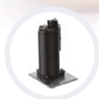
Rezgés csillapító lemez